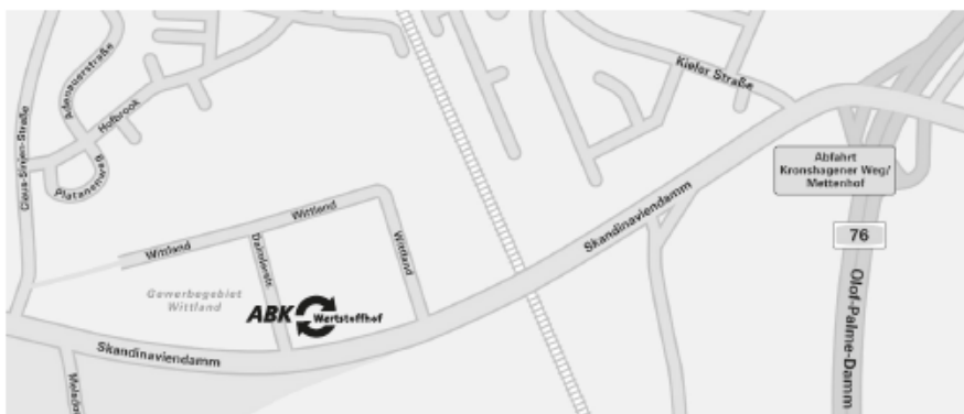
ABK-Wertstoffhof Daimlerstraße 2

März – Oktober: Di, Mi, Do 8.00 – 16.00 Uhr Mo + Fr 8.00 – 17.00 Uhr Sa 8.30 – 14.00 Uhr