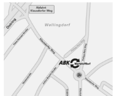
ABK-Wertstoffhof Klausdorfer Weg 177

Für Gewerbekunden gilt auf unseren beiden Wertstoffhöfen eine spezielle Entgeltordnung . Den Entgelten wird die gesetzliche Mehrwertsteuer hinzugefügt, die Gebühren sind dagegen von der Mehrwertsteuer befreit. Bei einem nicht vollständigen m 3 oder lfd. Meter wird das Entgelt nur anteilig berechnet.